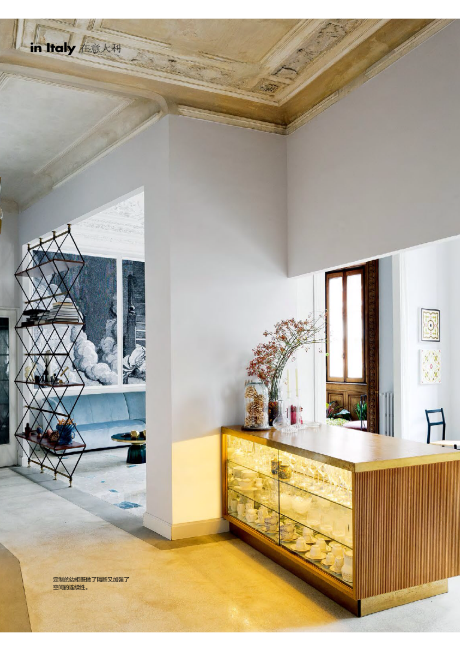
定制的边柜既做了隔断又加强了空间的连续性。