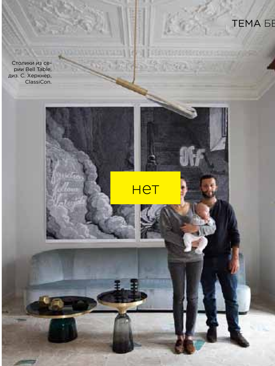
Столики из серии Bell Table, диз. С. Херкнер, ClassiCon.