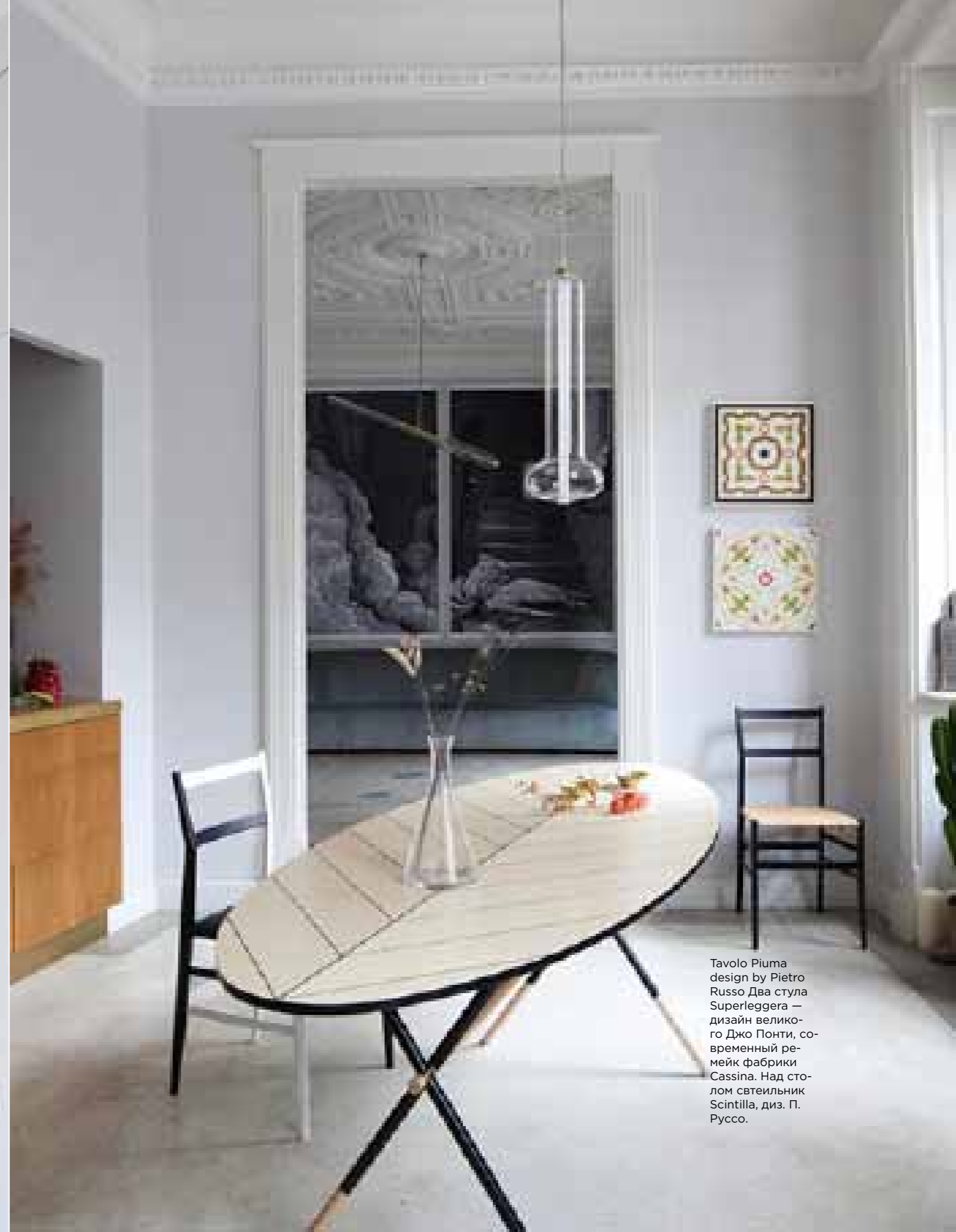
Tavolo Piuma design by Pietro Russo Два стула Superleggera — дизайн великого Джо Понти, современный ремейк фабрики Cassina. Над столом светильник Scintilla, диз. П. Руссо.