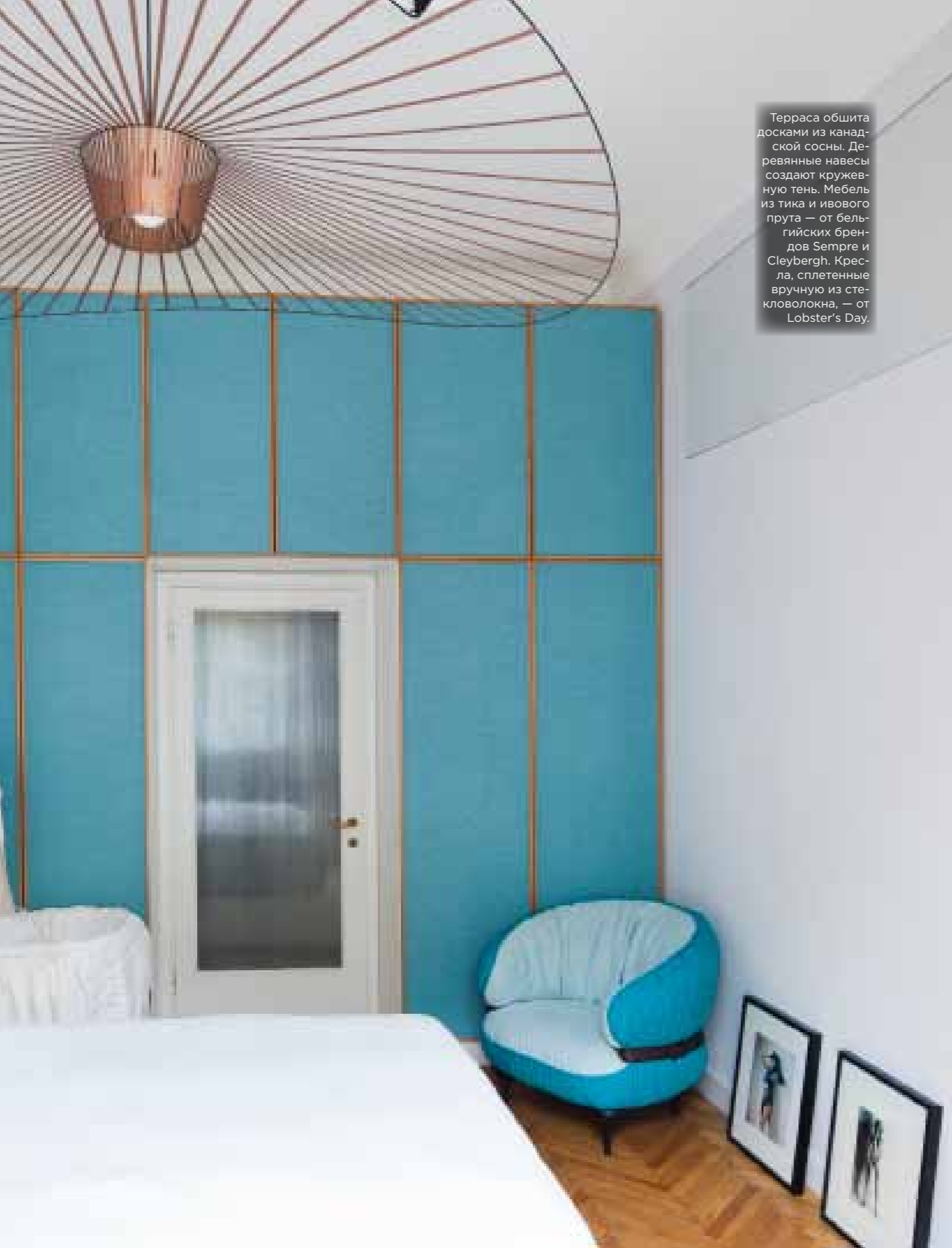
Терраса обшита досками из канадской сосны. Деревянные навесы создают кружевную тень. Мебель из тика и ивового прута — от бельгийских брендов Sempre и Sleybergh. Кресла, сплетенные вручную из стекловолокна, — от Lobster's Day.